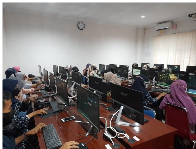
Gambar 1. Dokumentasi Pelaksanaan Career Preparation Training